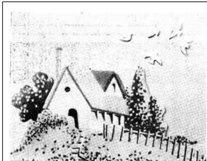
家 (粘贴画) 赵德秀