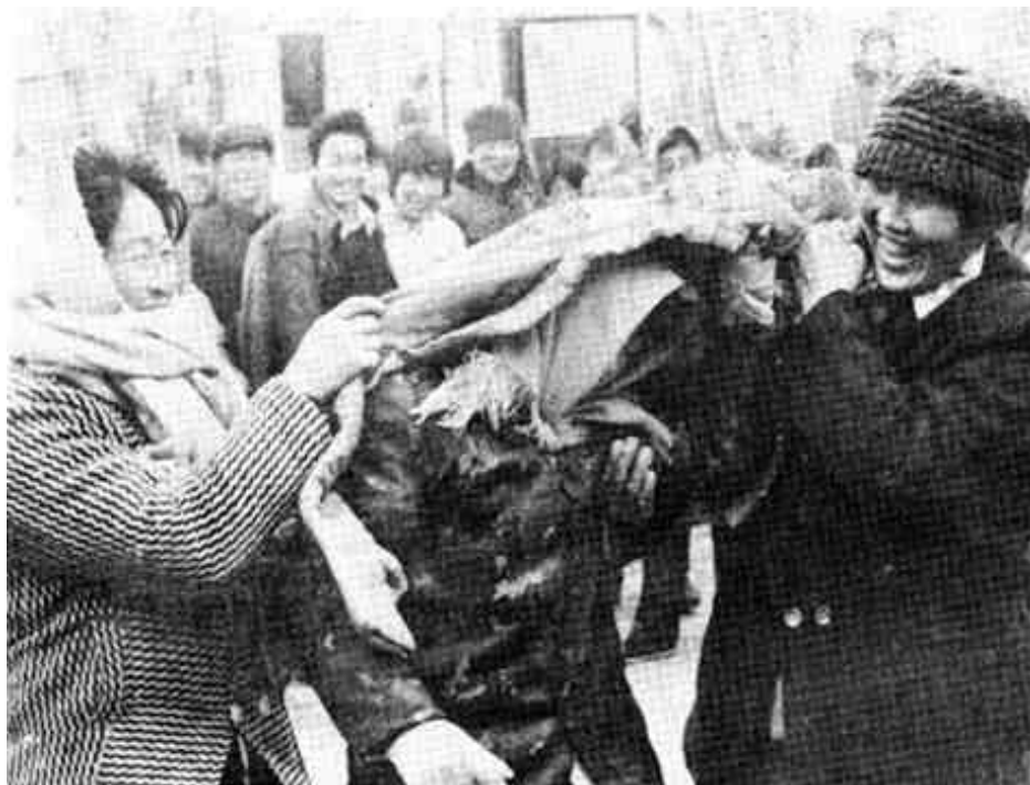
(左上)迎娶礼仪 (罩头)