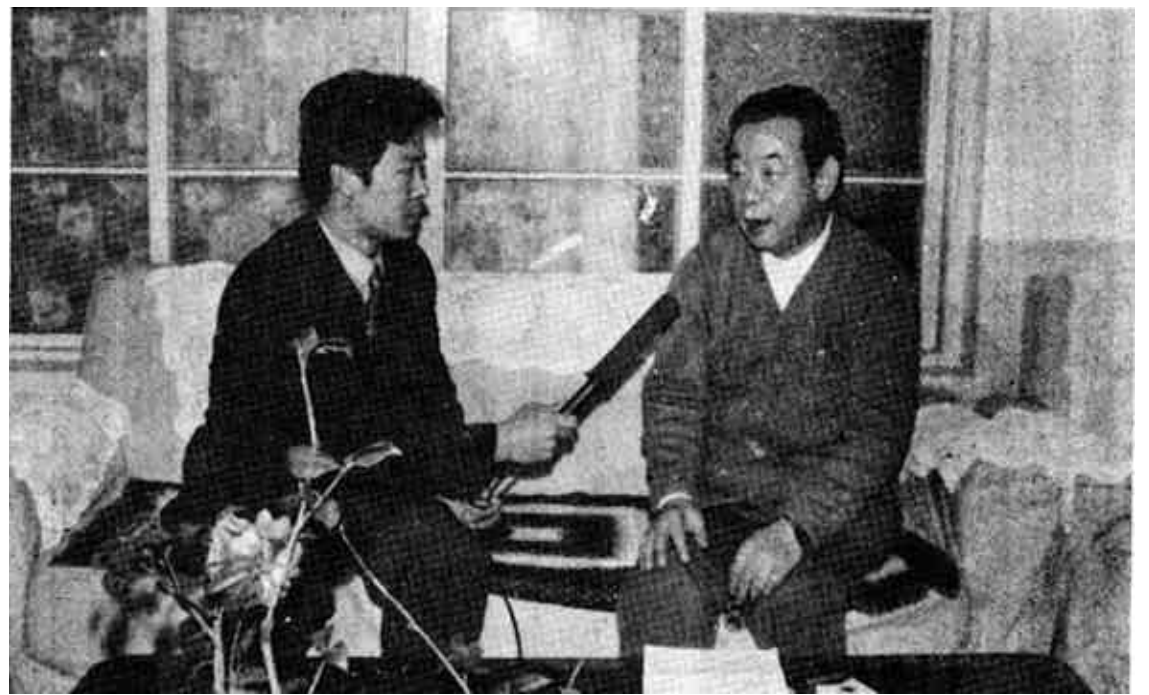
2月23日，副省长张瑞凤接受记者采访畅谈，东营港建设问题。他指出，东营港建设不仅促进区域经济的发展，而且对于完善我省港口布局和发展黄河三角洲世纪工程，都有十分重要的意义。